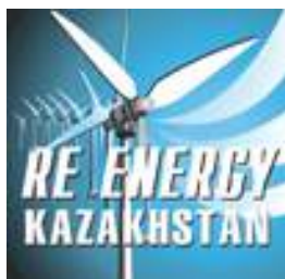
ReEnergy Kazakhstan 2017